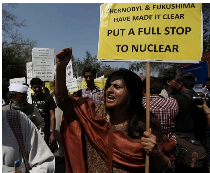
Manifestation antinucléaire en Inde