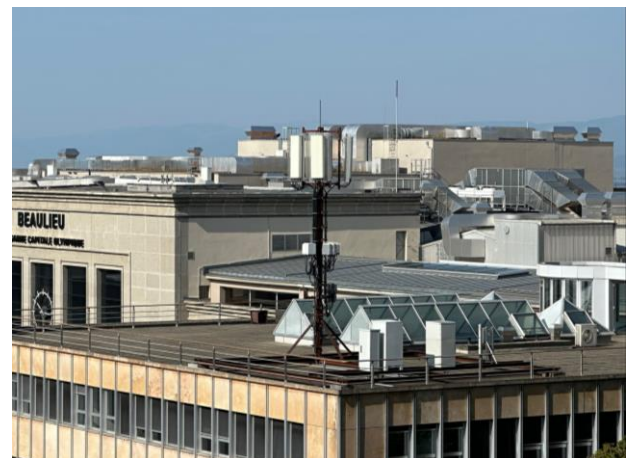
Photos de 2021 depuis la Violette et du 13 août 2023 depuis le « Café Perché »