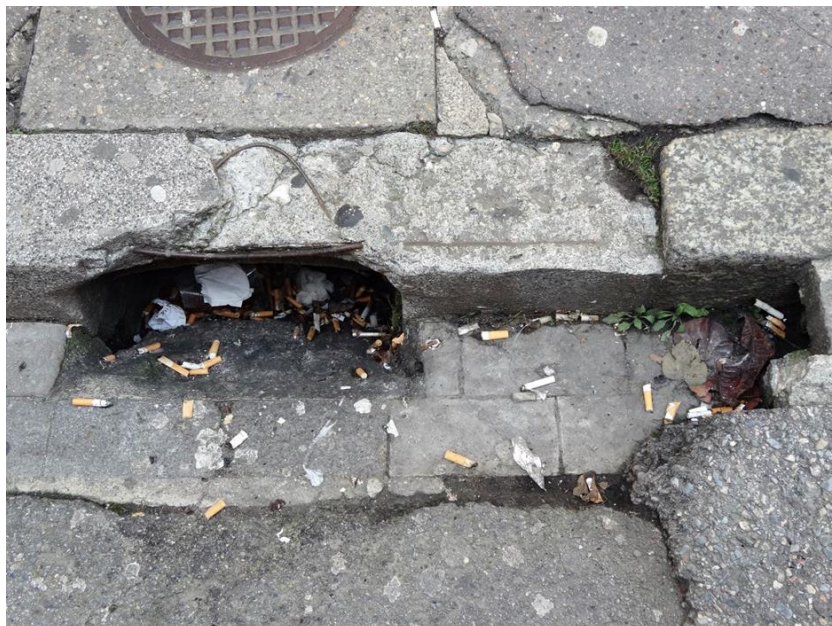
Figure 2: illustration du problème des mégots à Yverdon

Malgré les sommes investies et le travail considérable des employés communaux, les mégots restent omniprésents dans nos rues comme le montre l'illustration suivante.