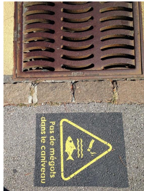
Figure 3: exemples de marquage au sol