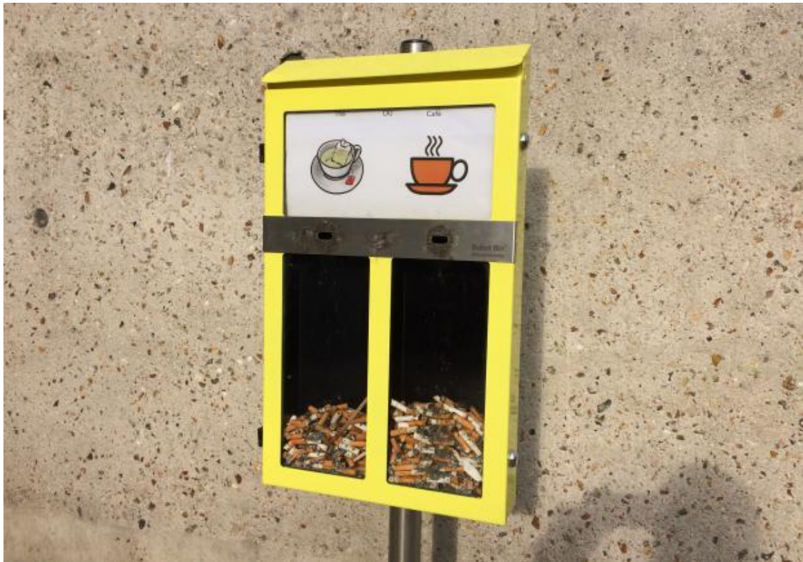
Figure 4: cendrier de vote

Le service des travaux de la Ville a également entrepris plusieurs actions. Mais le succès est très mitigé pour l'instant et il est donc nécessaire d'agir bien plus activement au niveau de la prévention, tout en n'oubliant pas que la répression est également nécessaire pour bien faire passer le message.